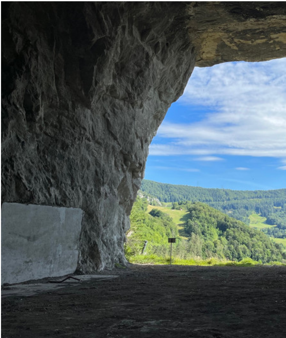
Vue depuis l'intérieur des fours à chaux de St-Ursanne.

Un projet d'envergure qui vise à réutiliser les anciens fours à chaux de St-Ursanne a été présenté lundi à Delémont. Le projet est basé sur une recommandation de mode de vie écologique basé sur cinq principes : Refuser les produits à usage unique, Réduire, Réutiliser, Réparer, Réinventer – ce que font par exemple les artistes de « waste art », qui créent à partir de déchets.